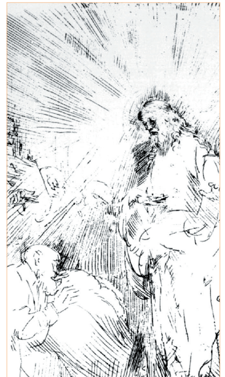
Rembrandt: Den opstandne frelser møder disciplene

Og kvinderne skyndte sig bort fra graven med frygt og stor glæde og løb hen for at fortælle hans disciple at Jesus var opstået fra de døde. Og se, Jesus kom dem i møde og hilste dem med et "God morgen!" Og de gik hen og omfavnede hans fødder og tilbad ham. Da sagde Jesus til dem: »Frygt ikke! Men gå hen og sig til mine brødre, at de skal gå til Galilæa. Der skal de se mig.« Mt. 28,9f