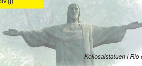
Kolossalstatuen i Rio de Janeiro

ved I ikke, at alle vi, som er blevet døbt til Kristus Jesus, er døbt til hans død? Vi blev altså begravet sammen med ham ved dåben til døden, for at også vi, sådan som Kristus blev oprejst fra de døde ved Faderens herlighed, skal leve et nyt liv. For er vi vokset sammen med ham ved en død, der ligner hans, skal vi også være det ved en opstandelse, der ligner hans. ROM 6,3-5.