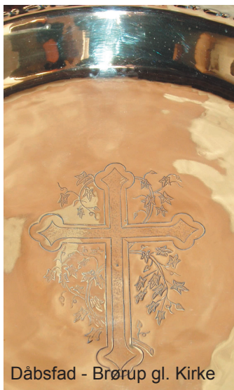
Dåbsfad - Brørup gl. Kirke

Korset er kristendommens hovedsymbol. Jesus Kristus blev korsfæstet. Alligevel er korset ikke et dødssymbol. Korset i dåbsfadet udtrykker det ved, at et livstræ vokser omkring korset.