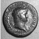
Kejser Neros guddommelige profil på en mønt.

Først lod man dem pågribe, som tilstod; de angav så under forhør en meget stor mængde andre. Nu ikke bare under anklage for brandstiftelse, men for "had til menneskeslægten". Man nøjedes ikke med at henrette dem, men drev oven i købet løjer med dem: nogle blev dækket med dyrehuder og