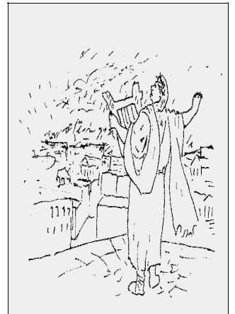
Kejser Nero synger under Roms brand

sønderrevet af hunde; andre korsfæstedes, og atter andre blev indsvøbt i brandbare klæder og blev brugt til at oplyse natten.