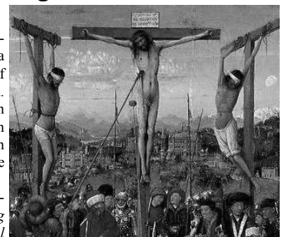
Jesus af Nazareth blev henrettet sammen med to andre oprørere.

Jesusbevægelsen tilhængere er ikke så lette at finde. De frygter forfølgelse. De citerer Jesus for også at have sagt: "Man vil lægge hånd på jer og forfølge jer, udlevere jer til synagogerne og kaste jer i fængsel, og I vil blive ført frem for konger og