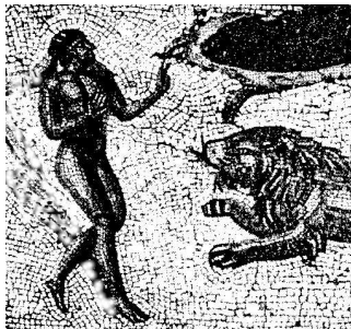
Mosaik: Løve overfalder martyr i arenaen

Caesarea, år 45 Bystyrets forsøg på at statuere et eksempel på vandrerprædikanten Paulus fra Tarsus endte i en tragedie. Paulus var blevet arresteret for at udbrede samfundsskadelig lære og ført til teatret. Der havde man indfanget en usædvanlig stor løve, som til skræk og advarsel skulle fortære ham. Men da Paulus kom ind på arenaen til løven var det som løven hilste på ham og et sært sceneri udspillede sig. Fangen og løven talte med hinanden. Nogle sagde, det så ud som om de bad til Gud. Publikum blev