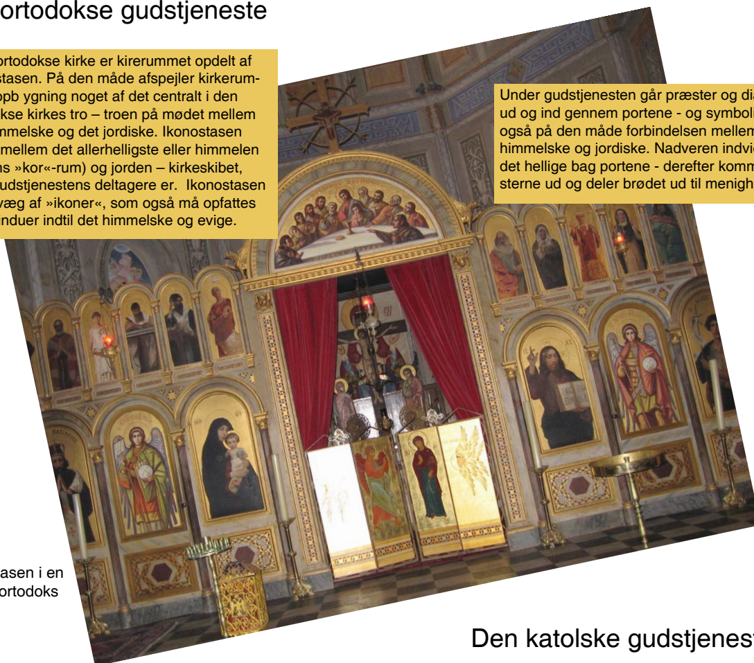
Ikonostasen i en græsk-ortodoks kirke.

I den ortodokse kirke er kirerummet opdelt af Ikonostasen. På den måde afspejler kirkerummets opbygning noget af det centralt i den ortodokse kirkes tro – troen på mødet mellem det himmelske og det jordiske. Ikonostasen skiller mellem det allerhelligste eller himmelen (kirkens »kor«-rum) og jorden – kirkeskibet, hvor gudstjenestens deltagere er. Ikonostasen er en væg af »ikoner«, som også må opfattes som vinduer indtil det himmelske og evige.